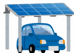
ソーラーカーポート